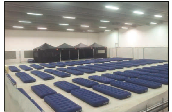
I uge 39 blev 120 luftmadrasser pumpet op og afskærmning til resten af hallen er foretaget.