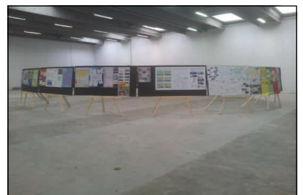
Resultatet for 48 timers innovations CAMP i Solbjerg efterfølgende ophængt for byens borgere i lagerbygningen. Klar til fremvisning.