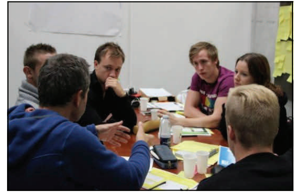
I uge 40 arbejde i alt 17 grupper af 6-8 personer i innovationsforløbet og var i dialog med borgerne.