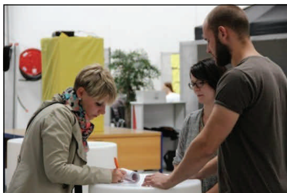
Interessen var også tilstede fra pressens side. Her repræsenteret ved Lokalavisen Aarhus