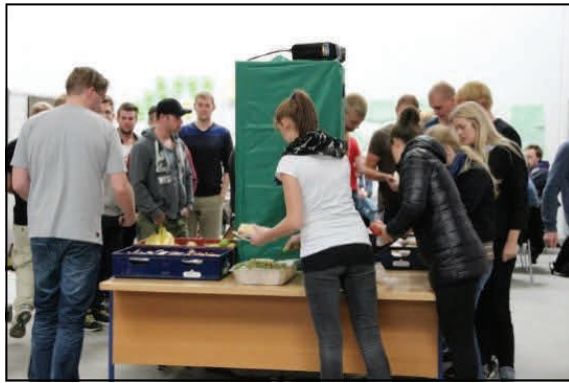
I uge 40 arbejde de studerende. Middag og aften bespisning leveret i samarbejde med Gourmiddag A/S