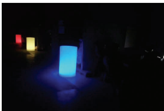
Orienterings belysning i løbet af natten leveret i samarbejde med Rodkjær, Solbjerg